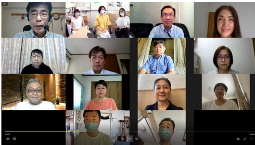
関東ブロック会議